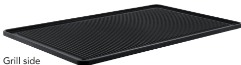
Grill side Le côté grill